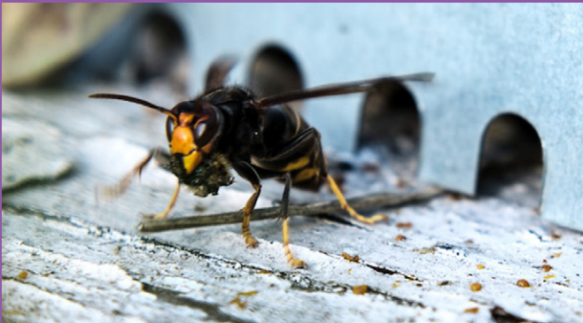
Le frelon asiatique caractérisé par ses pattes jaunes

L'association partenaire transmet ensuite les informations utiles à la commune et aux services concernés.